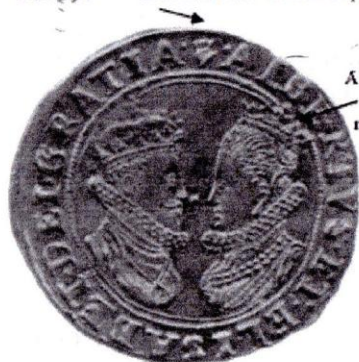
Albrecht en Isabella met kroon

Net zoals in de schilderkunst het portret heel erg populair werd, is dat ook zo in de numismatiek. Na lange tijd werd er, in navolging van het Oude Rome, een beeltenis van de koningen op de munten geslagen. We doen dat nog altijd, zoals op onze euro's met Albert II. Bij de gouden soeverein kijken Albrecht en Isabella elkaar aan.