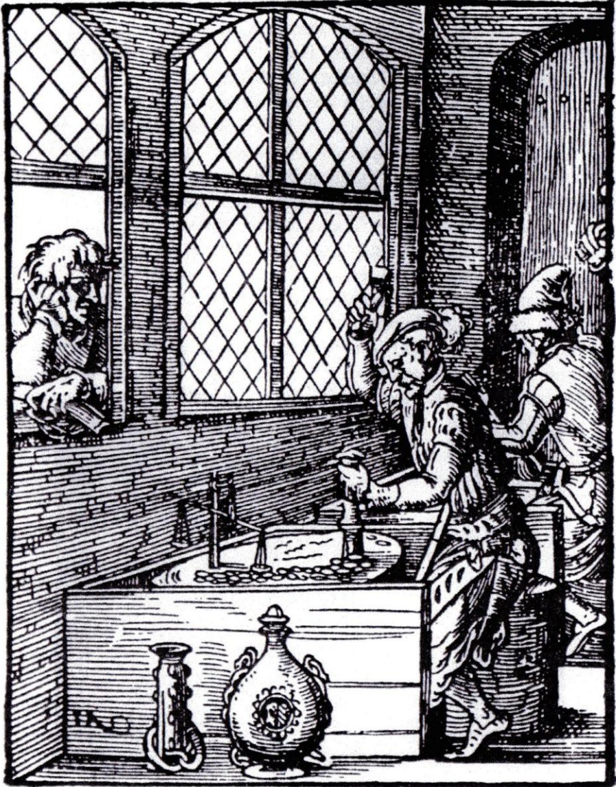
Muntatelier. Houtsnede uit 1568 door Joost Amman – Munt te Leuven

Op onze 2 e beurs van zondag 11 december zal een muntslager in actie te zien zijn. Hij maakt ter plaatse munten aan met stempel en hamer en ook met de schroefpers. Deze munten kunnen meegenomen worden. Een bijhorende tentoonstelling verduidelijkt heel het productieproces.