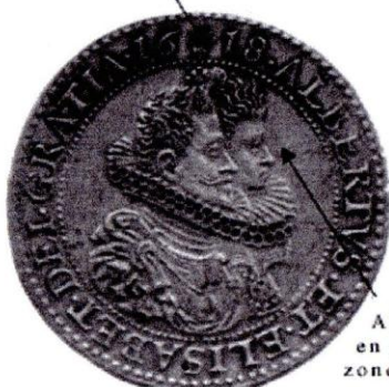
Albrecht en Isabella zonder kroon